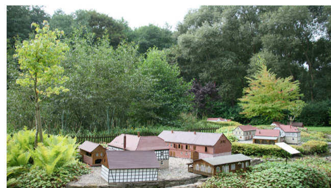
Miniatur-Mühlthal an der Robertsmühle

Klappernde Mühlen am rauschenden Bach – alte Papier-, Getreide-, Holz- und Lumpenmühlen gibt es noch in den Seitentälern der Saale. Meist abseits der Städte und Dörfer wurden die Mühlen entlang der Bäche in den romantischen Tälern erbaut. 25 Mühlen verbindet der Rundkurs des Thüringer Mühlenradwegs und führt dabei durch drei der schönsten Täler des Saalelandes - den Zeitgrund, das Mühlthal und das Tal der Gleise.