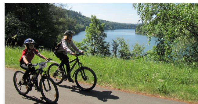
An der Ködeltalsperre

Wald- und Wasserreichtum prägen das Rodachtal. Hier wurde das Holz früher auf Flößen transportiert. In diesem wunderbaren Tal erlebt man eine Zeitreise von der Vergangenheit in die Moderne. Vorbei geht es an der Ködeltalsperre, auch "Frankenwald-Fjord" genannt, eines der idyllischsten Ausflugsziele im Frankenwald mit smaragdfarbenem Wasser. Diese entspannte Radtour führt bis Kronach nur bergab - ein idealer Fahrradausflug für Familien.