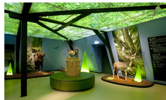
Hörstation regionaler Sagen und Legenden im Haus der Natur Goldisthal

Das Schwarzatal mit seinen romantischen Wegen und Pfaden führt durch die abwechslungsreiche Kulturlandschaft im östlichen Teil des Naturparks Thüringer Wald. Eine Kombination aus Natur pur und der Burgenlandschaft an der Saale machen das Schwarzatal zum Wander- und Fahrerlebnis. Von seinen Höhen hat man einen weiten Blick über den Thüringer Wald und das Thüringer Schiefergebirge.