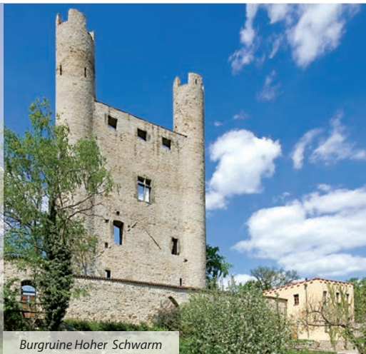
Burgruine Hoher Schwarm