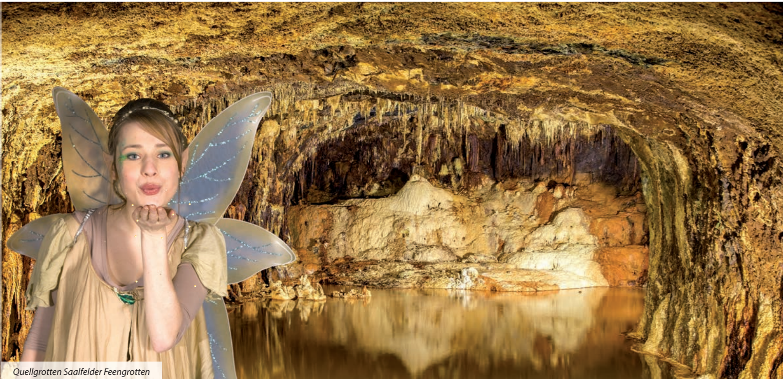
Quellgrotten Saalfelder Feengrotten