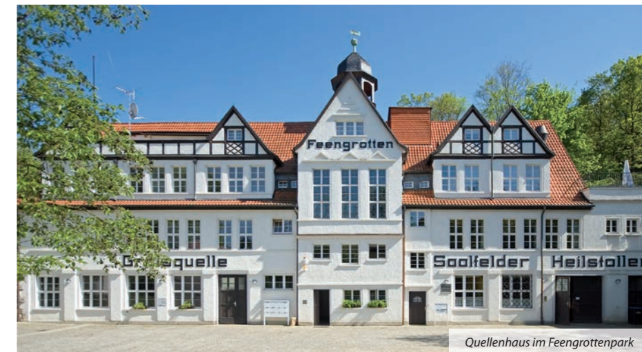
Quellenhaus im Feengrottenpark